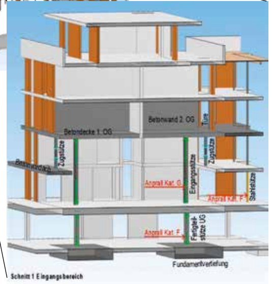
Schnitt I Eingangsbereich