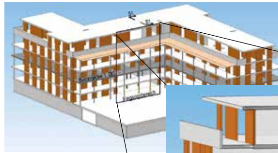
3D-Modell mit Auszug des Eingangsbereichs