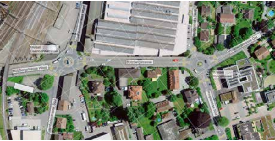
Luftbild der Bützbergstrasse