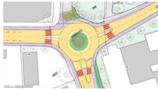
Plan des umgebauten Kreisels Ringstrasse