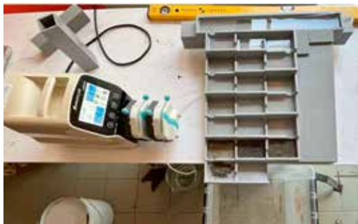
Essais maquette physique de la passe