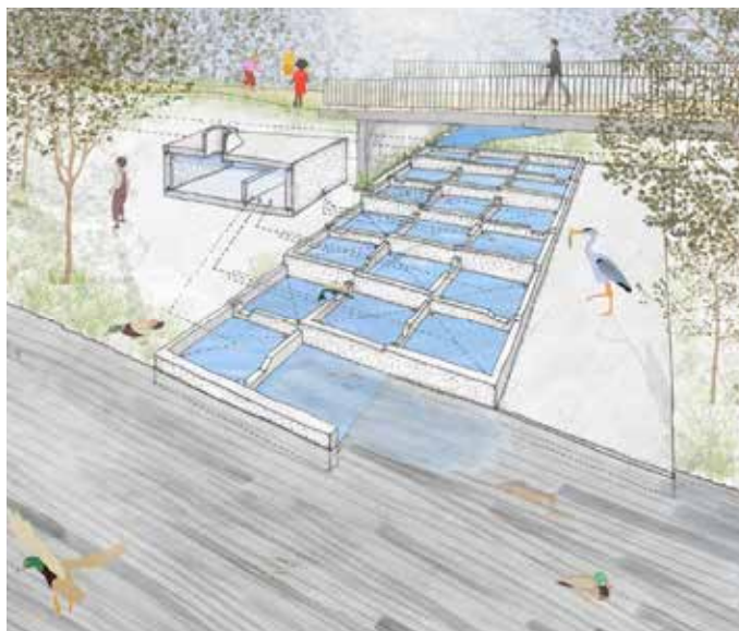
Axonométrie du projet