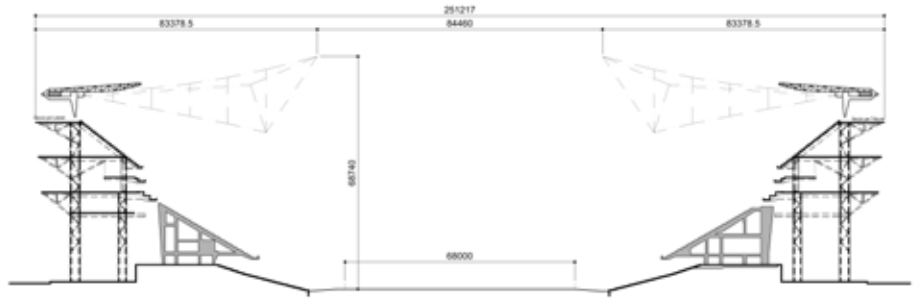
Grundlageplan (Schnitt des Stadions)